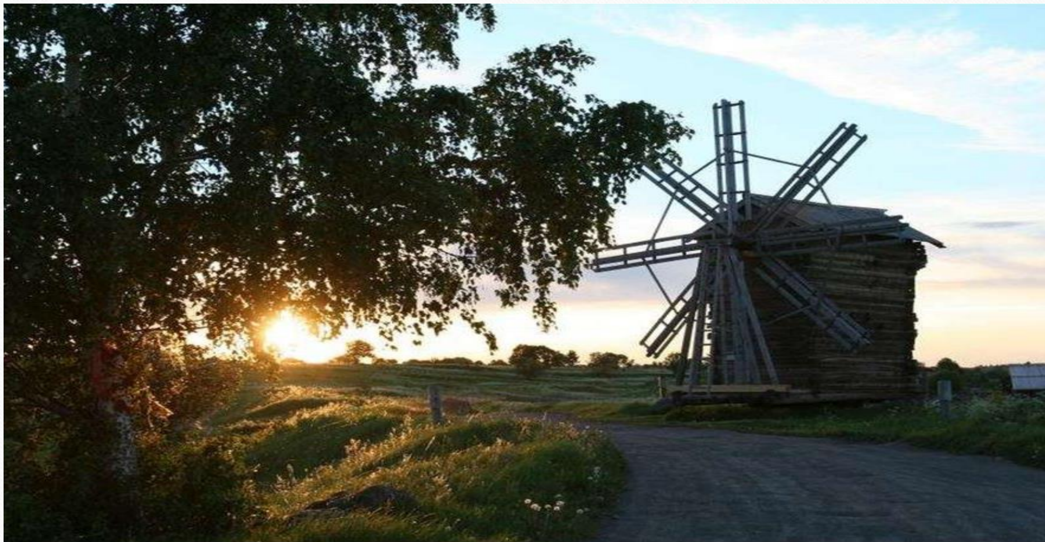
Мельница на острове Кижи