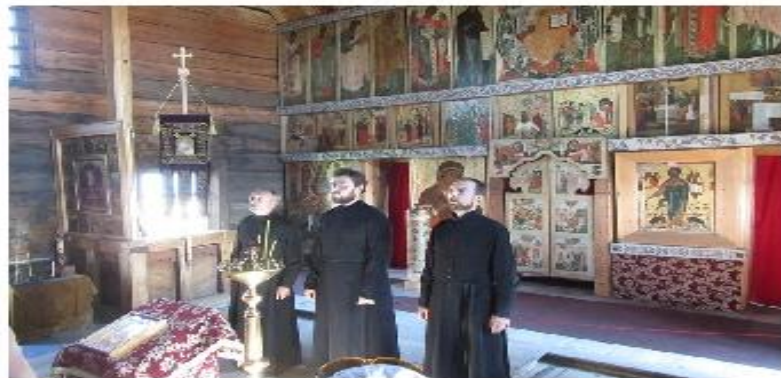
Певчие Покровской церкви